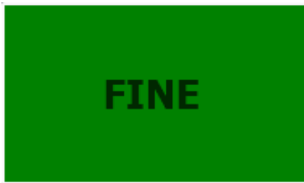
Pulsante non attivo

Una volta terminata la compilazione della lista di vendita e stabilito il metodo di pagamento, il pulsante fine si attiverà (vedi immagini).